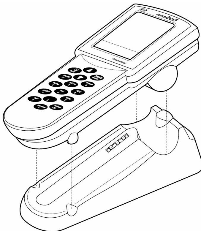
图 5 电源座